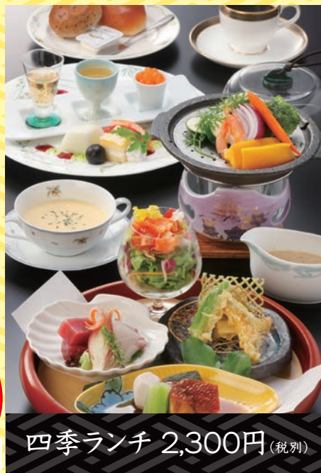
四季ランチ 2,300円 (税別)