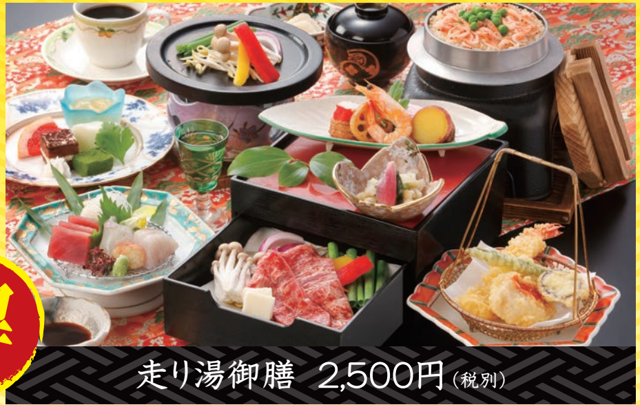
走り湯御膳 2,500円 (税別)

A 2,200円 (税込) プラン 下記1,500円までの メニューから1品お選び頂けます。