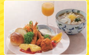
■お子様ランチ 900円 (税別)