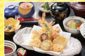
■天ぷら御膳 1,200円 (税別)

そば御膳は、 うどん、日本そば、 茶そば、(温・冷) お選びいただけます。 麺のみの単品も承ります。 (700円 税別)