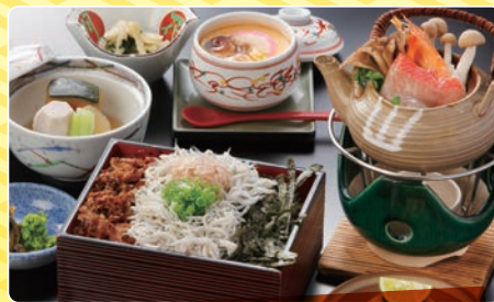
特製しらす重 1,500円 (税別)