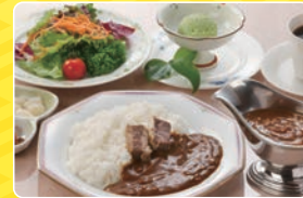
■ビーフカレー 1,100円 (税別)