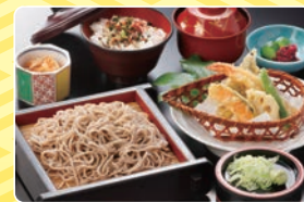
■そば御膳 1,200円 (税別)

そば御膳は、 うどん、日本そば、 茶そば、(温・冷) お選びいただけます。 麺のみの単品も承ります。 (700円 税別)