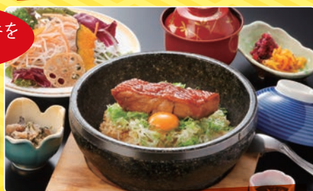
選べる石焼丼 1,500円 (税別)