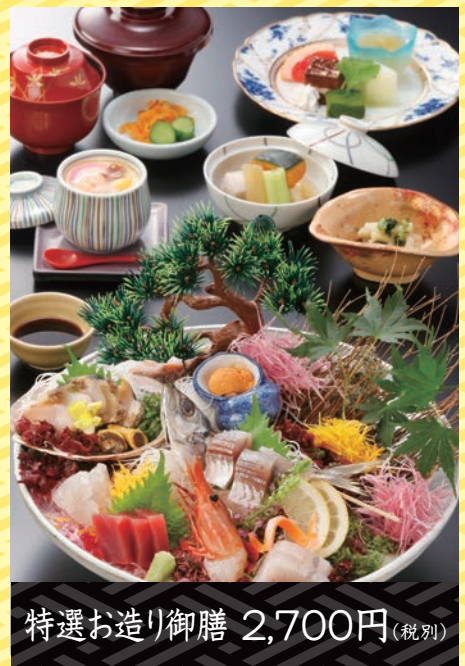
特選お造り御膳 2,700円 (税別)