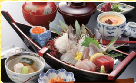
お造り御膳 1,500円 (税別)