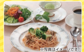
■月替わりパスタ 1,000円 (税別)